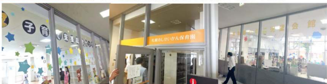
▲札幌都心部子ども関連複合施設。近隣4校を統合して誕生した新小学校+児童会館+保育園+子育て支援総合センターを有する複合施設です。各施設の相互交流は教育的にも効果が高いとの説明でした。