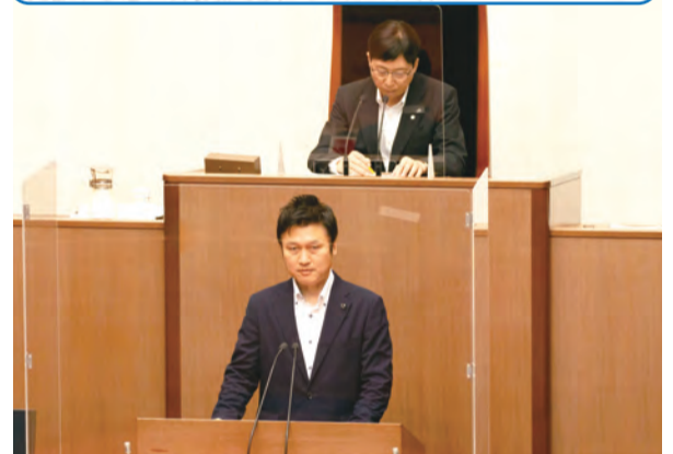
文教委員長として本会議において委員長報告を行った様子(7月2日)。