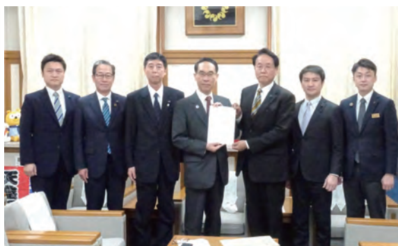
▲写真撮影に際し一時的にマスクを外しています。