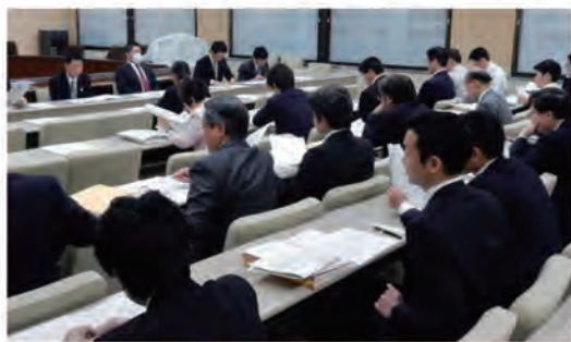
自由民主党議員団「犯罪被害者救済に関するプロジェクトチーム」の協議風景。

思いがけず被害に遭った犯罪被害者やその家族は、直接的な被害に加え精神的な問題や経済的な問題、居住場所や雇用などの問題など、さまざまな問題に直面します。犯罪被害者が再び平穏な生活を営むことができるようにするためには、社会全体がその立場に寄り添った支援を途切れなく行っていく必要があります。そこで自民党議員団では様々な施策を体系的に推進するための核となる条例を2月定例会で提案。多くの賛成を得て成立させることができました。