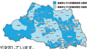
県内全63市町村のプロジェクト参加が決定しています。

新ビジネスピッチの実施(従来のガバメントピッチに加え、まちづくりに役立つ優れた技術やサービスを企業等から市町村に提案する場を新たに創出し、伴走支援を実施することでマッチングを強化)、新都市計画基礎調査などの客観的データ分析、他