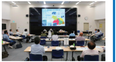
埼玉版FEMA図上訓練の様子

新シナリオの新規作成やブラッシュアップを繰り返す埼玉版FEMA訓練を全庁で実施(30回、延べ約950機関、参加予定人数約2,800人)、新危機・災害に的確に対応できる防災人材を育成(対象者約9,200人(県職員等))、新危機・災害対応の標準化のため、埼玉版FEMAプロトコルを策定中、他